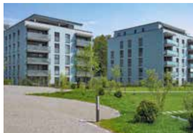
Tschann, Buchrain . 2006 – 2007

47 Wohneinheiten, 12 Alters- wohnungen, 16 Pflegezimmer