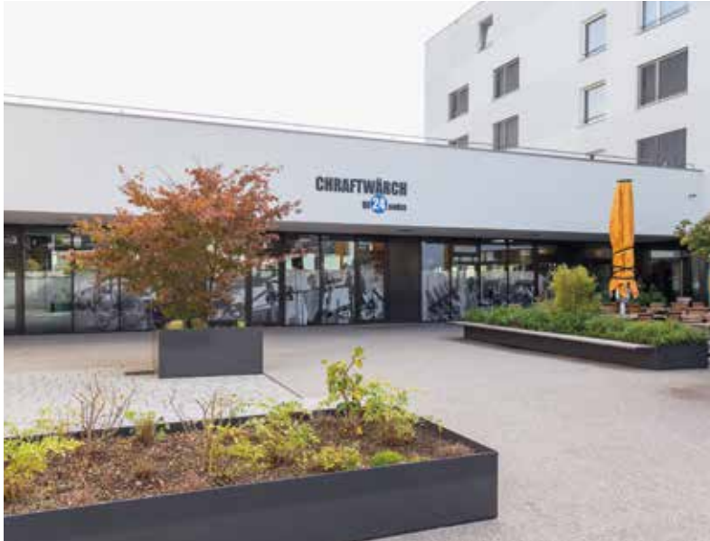
Fitnesscenter Zentrum Maiengrüni, Neuenkirch . 2017