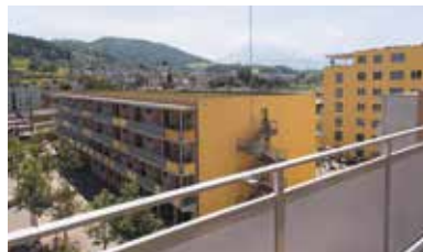
Halte, Ebikon . 2012 – 2015

106 Wohneinheiten, 68 Senioren- wohnungen, 22 Pflegezimmer, Therapieräume, Restaurant/Café, Doppelkindergarten