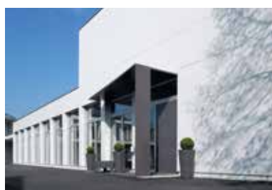
Pfarreizentrum, Udligenswil 2008

Ruhe- und Abschiedsraum | Erweite- rungsbau, Erneuerung Fassade, Aufstockung eines Geschosses