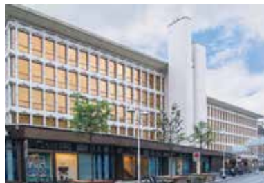
Luzerner Kantonalbank, Luzern 2006 – 2015

Bankgebäude | Aussen- und Innensanierung