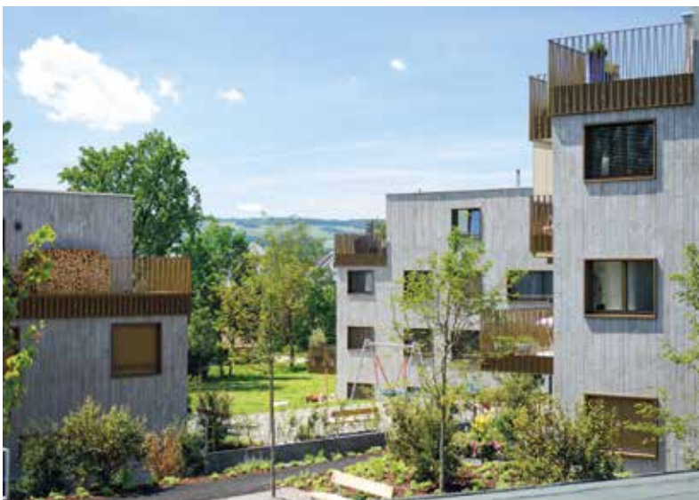
Chilenfeld, Obfelden . 2016 – 2018