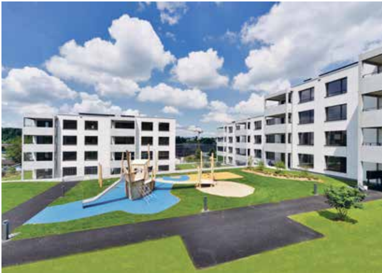
Höfli, Ebikon . 2016 – 2018