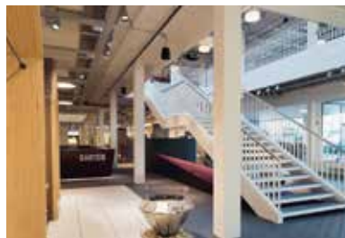
SABAG, Rothenburg . 2014 – 2016