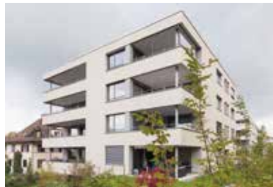
1. und 2. Etappe Blumenweg, Root 2015 – 2017