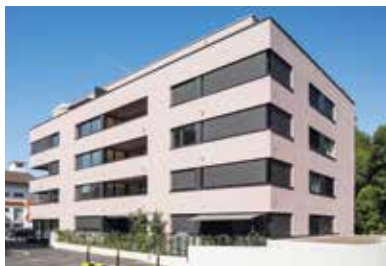
Bergstrasse, Neuenkirch 2016 – 2017