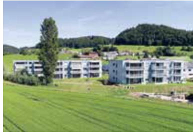
Brunnenmatte, Reiden . 2016 – 2018