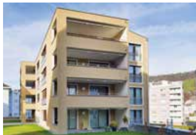
Wichlernweg, Kriens . 2016 – 2017