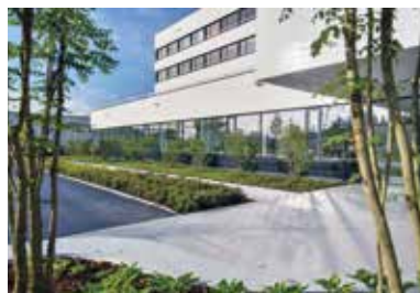
SABAG, Rothenburg . 2014 – 2016

Erneuerung Ausstellung- und Verwaltungsgebäude | Totalsanierung