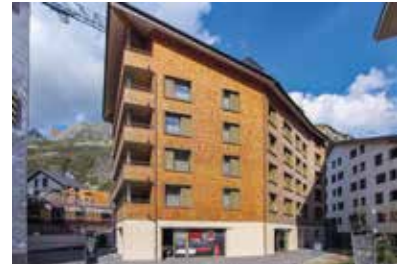
Wolf und Edelweiss, Andermatt 2016 – 2017