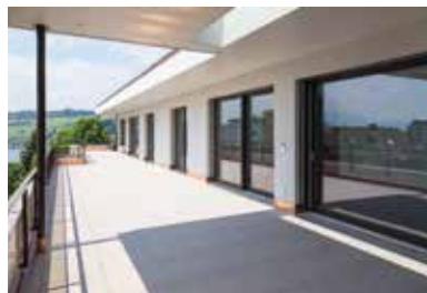
Grepperstrasse, Küssnacht am Rigi 2016 – 2017

Mehrfamilienhaus mit 14 Mietwohnungen | Totalsanierung