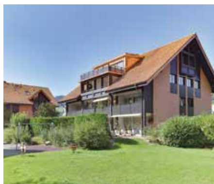
Wichlernweg, Kriens . 2016 – 2017

Mehrfamilienhaus mit 14 Wohneinheiten | Totalsanierung