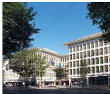
Luzerner Kantonalbank, Luzern 2006 – 2016

3 Mehrfamilienhäuser mit 27 Wohneinheiten | Totalsanierung