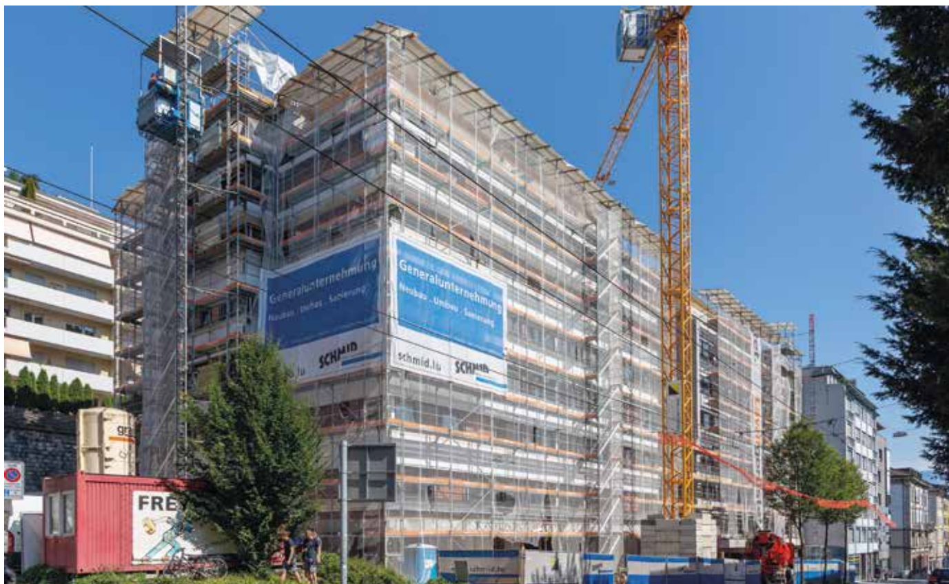
Wesemlinstrasse, Luzern . 2017 – 2019

2 Mehrfamilienhäuser mit 74 Wohneinheiten, 50 bis 345 m 2 Verkaufs- und Büroflächen | Totalsanierung