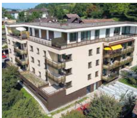
Grepperstrasse, Küsnacht am Rigi 2016 – 2017

2 Mehrfamilienhäuser mit 74 Wohneinheiten, 50 bis 345 m 2 Verkaufs- und Büroflächen | Totalsanierung